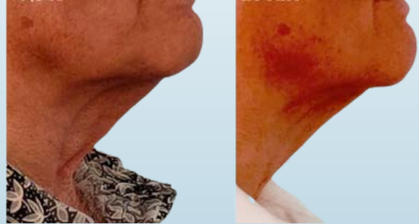
KAULAN JA LEUAN HOITO ENNEN JA JÄLKEEN

Syvän dermiksen jäähdytys stimuloi fibroblastien toimintaa lisäämällä uusien kollageeni- ja elastiinikuitujen lisääntymissynteesiä: termoshokin yhteydessä kollageenin ja elastiinin tuotanto lisääntyy, jolloin ihosta tulee kireämpi ja kimmoisampi. Fibroblastit säilyttävät sidekudosten rakenteellisen eheyden muodostamalla sidekudokseen säiemäisiä valkuaisaineita.