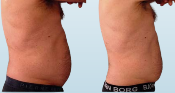
VATSAN HOITO ENNEN JA JÄLKEEN

Kylmähoiton kohottava ja kiinteyttävä vaikutus ehkäisee ja korjaa tehokkaasti kasvojen ja vartalon ihon roikkumista. Kudoksen luonnollinen jännite ja kiinteys palautetaan lämpötilan vaihteluilla ja aktivoimalla fibroblastit tuottamaan uutta kollageenia ja elastiinia.