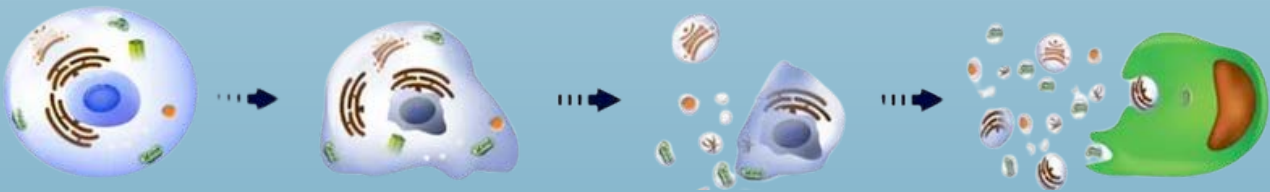
CRYOHOITO KÄYNNISTÄÄ APOPTOOSIN RASVASOLUISSA

Osmo Therm 21 on terapeuttinen ja luonnollinen menetelmä rasvanpoistoon ilman leikkausta. Hoito on ns. rasvan jäädytysmenetelmä, jossa liikuteltava hoitopää pitää lämpötilan -5^{\circ}\text{C} ja -10^{\circ}\text{C} asteen välillä vähentäen asteittain käsiteltävän ihoalueen lämpötilaa 34^{\circ}\text{C} asteesta 8^{\circ}\text{C} asteeseen. Rasvasolut reagoivat kylmään ympäröiviä soluja herkemmin ja jäähtymisen yhteydessä käynnistyy prosessi, jota kutsutaan apoptoosiksi .