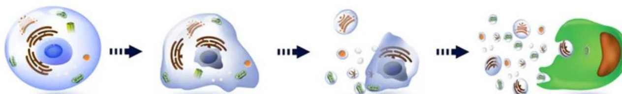
CRYOHOITO KÄYNNISTÄÄ APOPTOOSIN RASVASOLUISSA

Osmo Therm 21 on terapeuttinen ja luonnollinen menetelmä rasvanpoistoon ilman leikkausta. Hoito on ns. rasvan jäädytysmenetelmä, jossa liikuteltava hoitopää pitää lämpötilan -5^{\circ}\text{C} ja -10^{\circ}\text{C} asteen välillä vähentäen asteittain käsiteltävän ihoalueen lämpötilaa 34^{\circ}\text{C} asteesta 8^{\circ}\text{C} asteeseen. Rasvasolut reagoivat kylmään ympäröiviä soluja herkemmin ja jäähtymisen yhteydessä käynnistyy prosessi, jota kutsutaan apoptoosiksi.