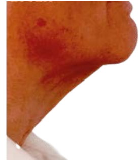
KAULAN JA LEUAN HOITO ENNEN JA JÄLKEEN

Syvän dermiksien jäähdytys stimuloi fibroblastien toimintaa lisäämällä uusien kollageeni- ja elastiinikuitujen lisääntymissynteesiä: termoshokin yhteydessä kollageenin ja elastiinin tuotanto lisääntyy, jolloin ihosta tulee kireämpi ja kimmoisampi. Fibroblastit säilyttävät sidekudosten rakenteellisen eheyden muodostamalla sidekudokseen säiemäisiä valkuaisaineita.