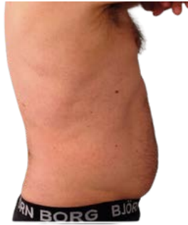
VATSAN HOITO ENNEN JA JÄLKEEN